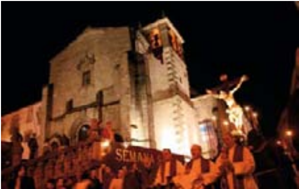
EL VÍA CRUCIS DE HOMBRES SALIENDO DE SAN FRANCISCO

paso del “ Cristo de la Vera Cruz ” (S.XV), organizado por la Hermandad de la Santa Cruz. Se recoge en la Iglesia de Santa María el paso de “ María al Pie de la Cruz ” (Modesto Quilis - 1.908)