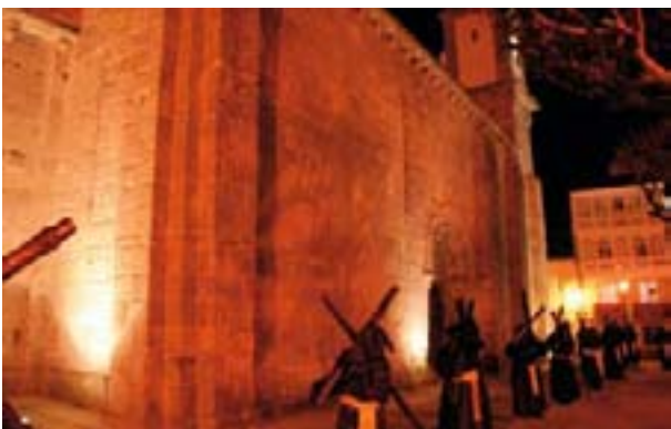
PENITENTES DE LA SANTA CRUZ