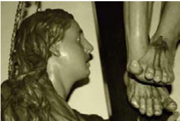
DETALLE DEL CALVARIO — FOTOGRAFÍA: JOSÉ MANUEL PALEO FERNÁNDEZ

En esta procesión desfila el ya mencionado paso del Prendimiento , a continuación se incorporará el Ecce-homo de la Misericordia , le sigue el paso de Las Siete Palabras representado el Calvario con el Cristo de la Agonía (José Rivas, 1.946), los dos ladrones (Rodríguez y Puente, 1.952) y a sus pies las imágenes de María Magdalena , San Juan y La Virgen (José Rivas, 1.949). Le sigue el paso del Cristo de la Piedad (José Rivas, 1.945), que representa a Cristo yacente en brazos de su Madre, al pie de una Cruz cuyo velo ondea al viento dando gran movimiento al conjunto. Marca el paso a los llevadores la banda de tambores de la Cofradía con espléndidos trajes de romanos con los colores blanco y negro de la misma. Finalmente desfila María al Pie de la Cruz (Quilis, 1.908) representando a la Hermandad de la Santa Cruz.