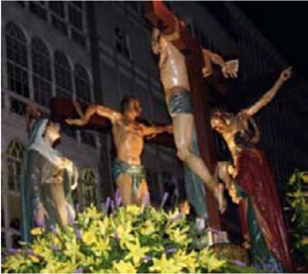
CALVARIO DE LAS SIETE PALABRAS