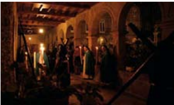
EL VÍA CRUCIS DE MUJERES EN LOS CLAUSTROS DE LAS CONCEPCIONISTAS

A las 8'30 de la tarde en la Parroquia de Santiago, Celebración Comunitaria de la Penitencia.